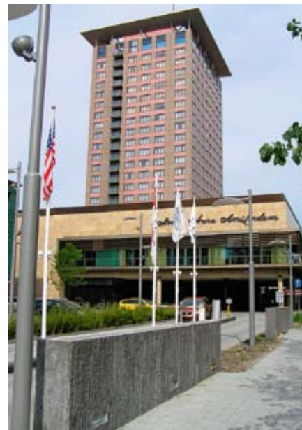
In den Sälen des Hotel Okura in Amsterdam fanden die zahlreichen Referate und Veranstaltung statt.

An der European Facility Management Conference 2009 (EFMC) vom 16. und 17. Juni in Amsterdam NL versammelten sich zum sechsten Mal über 450 FM-Expertinnen und -Experten aus 40 verschiedenen Ländern. Diskutiert wurde über FM-Strategien, Energie-Management, Nachhaltigkeit, Flächenmanagement sowie die Wirtschaftsentwicklung und ihre Herausforderungen in der Facility Management-Branche.